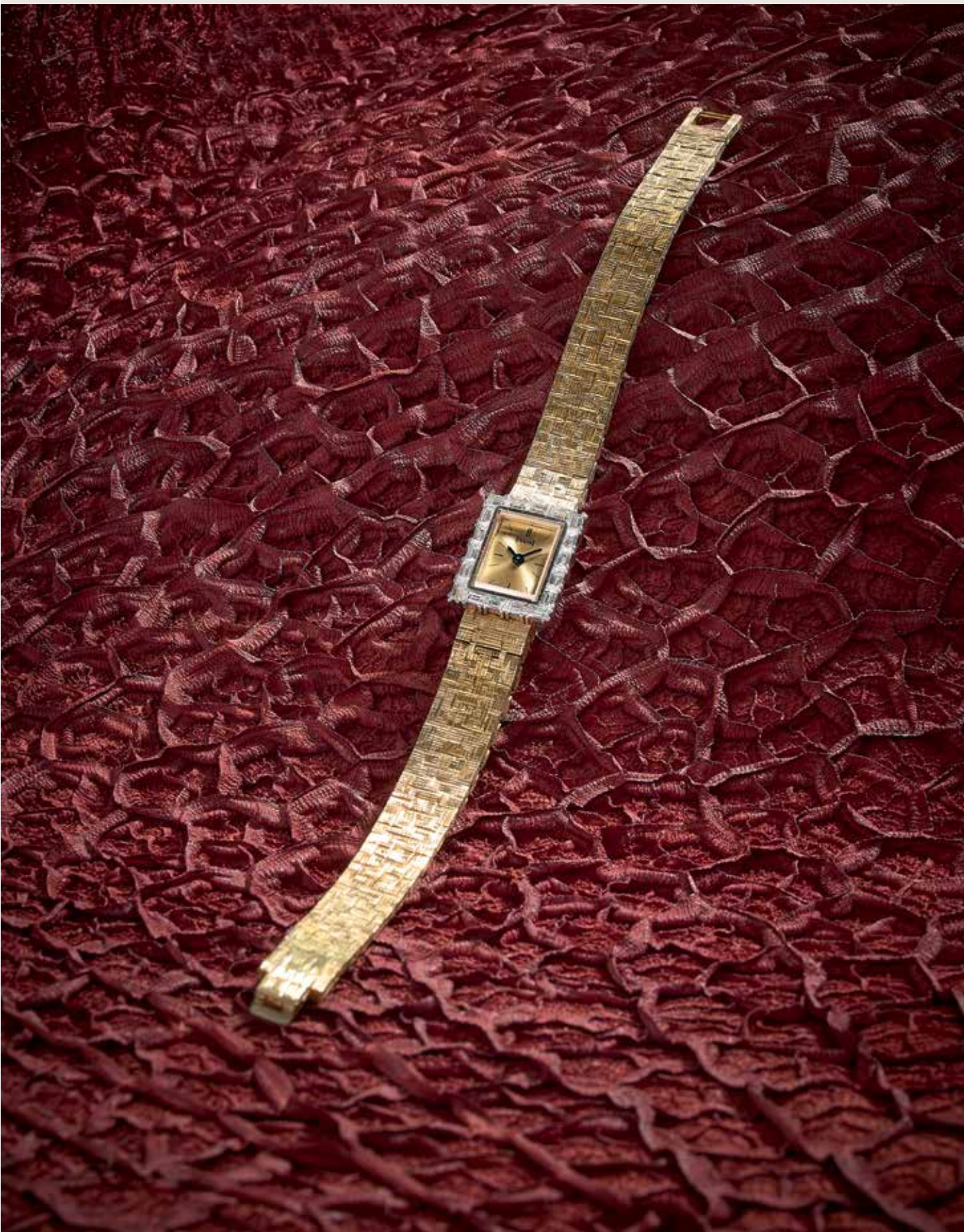
lot n°865, Piaget, Pièce Unique , ref. 1203 A5, n° 102139, vers 1964 p.60