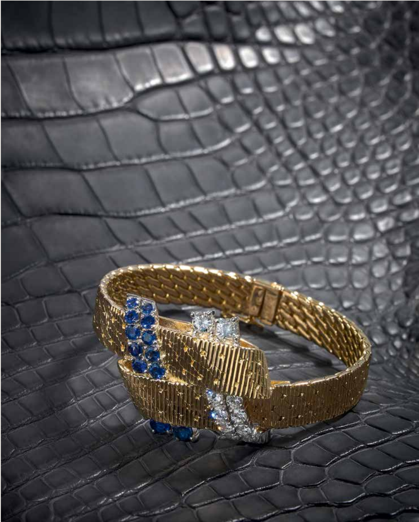
lot n°859, Patek Philippe, Ref. 3306/6J, n° 983329/2627631, vers 1959 p.57