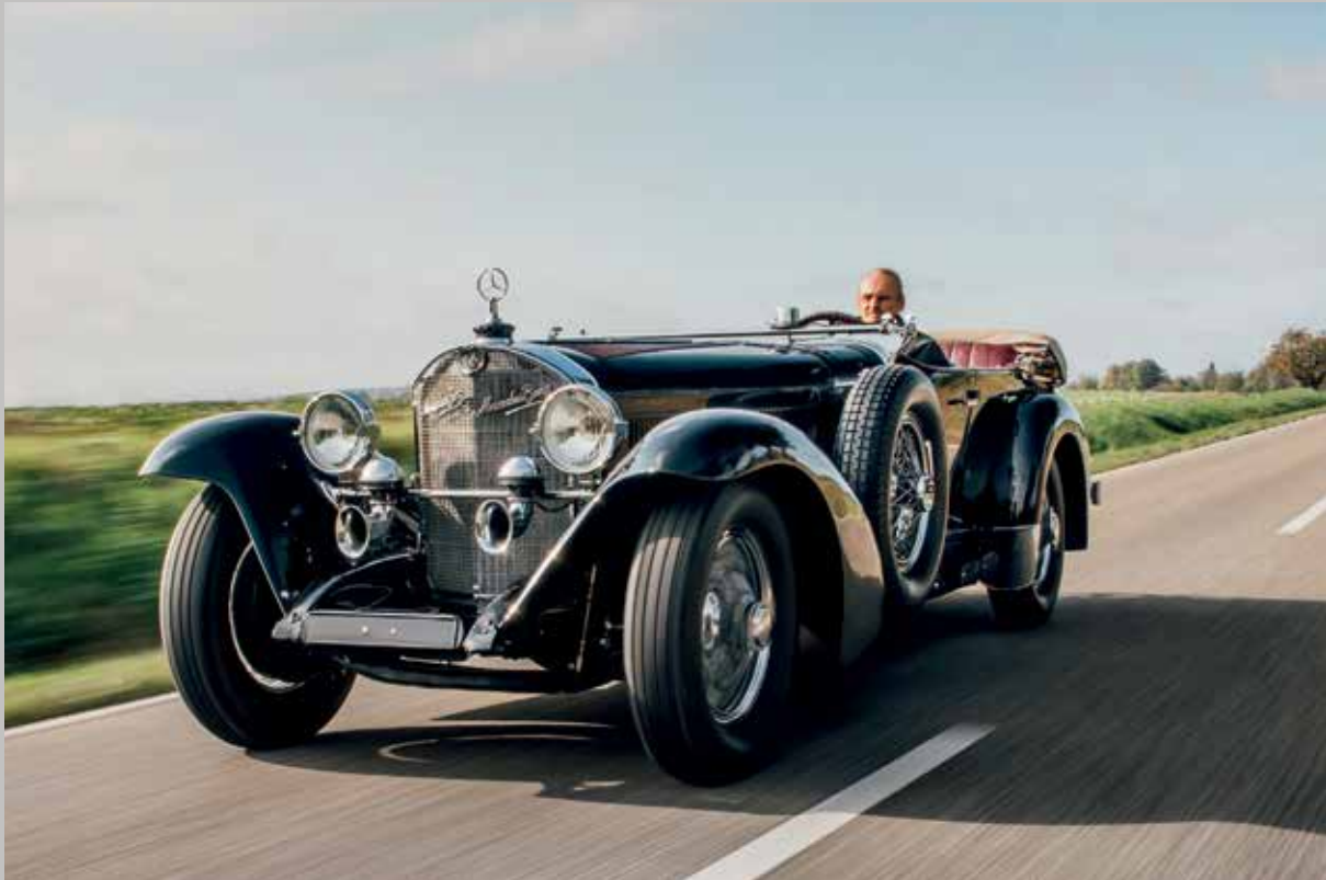
1929 Mercedes-Benz 710 SS Sport Tourer par Fernandez & Darrin